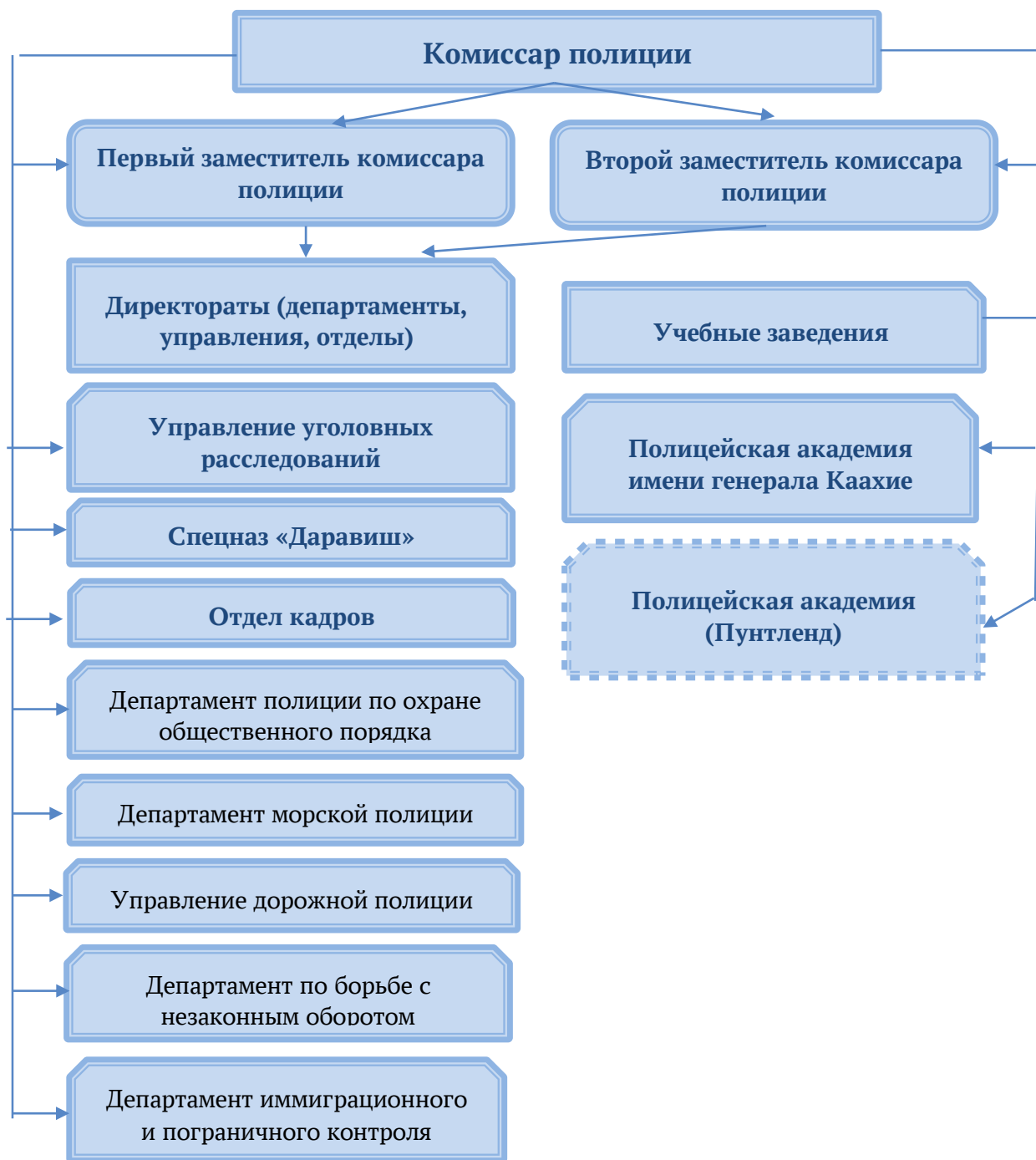
Рис. 3. Структура федеральной полиции Сомали

Руководитель окружного управления называется начальником полиции. На всей подконтрольной федеральным властям территории в экстренных случаях можно обратиться за помощью к полиции по единому телефонному номеру – 888.