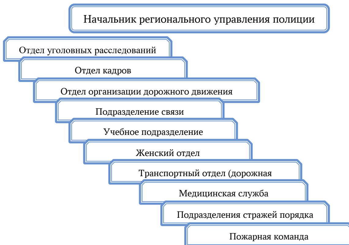
Рис. 5. Структура региональных управлений полиции

Непосредственно с гражданами взаимодействуют местные полицейские участки. В сельских поселениях и отдаленных местностях, как правило, организуются полицейские посты (напоминают наши пункты участковых уполномоченных полиции).