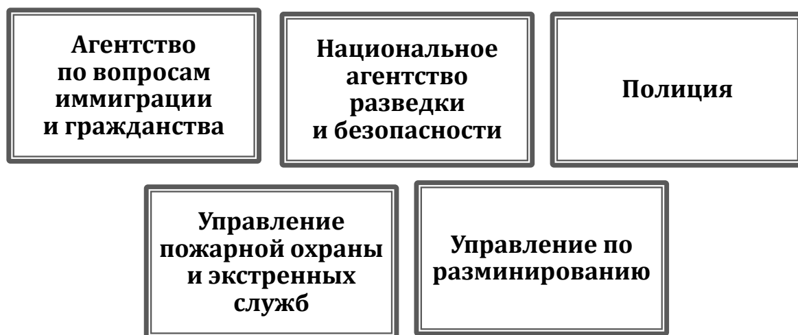
Рис. 1. Структура Министерства внутренней безопасности Сомали

В-третьих, юридической базой деятельности полиции являются иные законы о национальной безопасности и охране правопорядка. Данные законы регламентируют порядок применения силы полицией, проведение контртеррористических операций, обеспечение безопасности государственной границы, взаимодействие полиции с иными силовыми структурами – национальным агентством разведки и безопасности, армией.