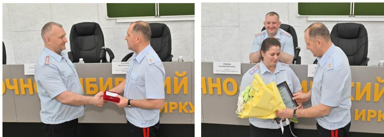
Рис. 2. Вручение наград сотрудникам ВСИ МВД России

За образцовое исполнение служебных обязанностей и высокое профессиональное мастерство сотрудники Института неоднократно поощрялись наградами по линии экспертной службы (рис. 2) 9 .