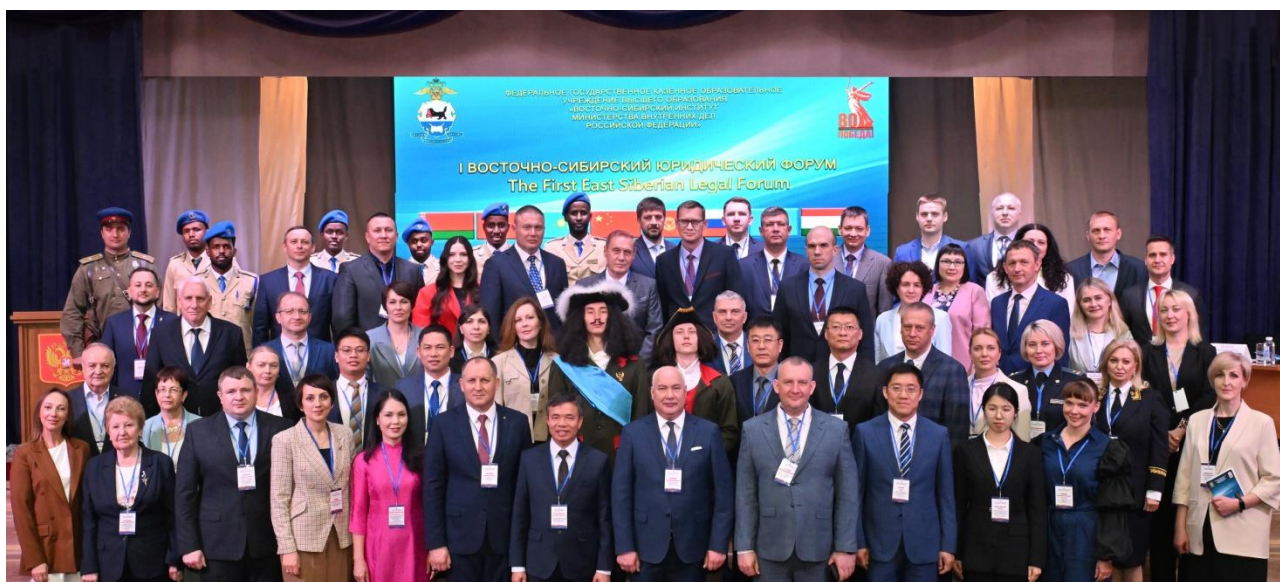
Рис. 6. Участники I Восточно-Сибирского юридического форума

В июне 2025 года в работе I Восточно-Сибирского юридического форума участвовали руководители ЭКЦ МВД России (рис. 6 – 7).