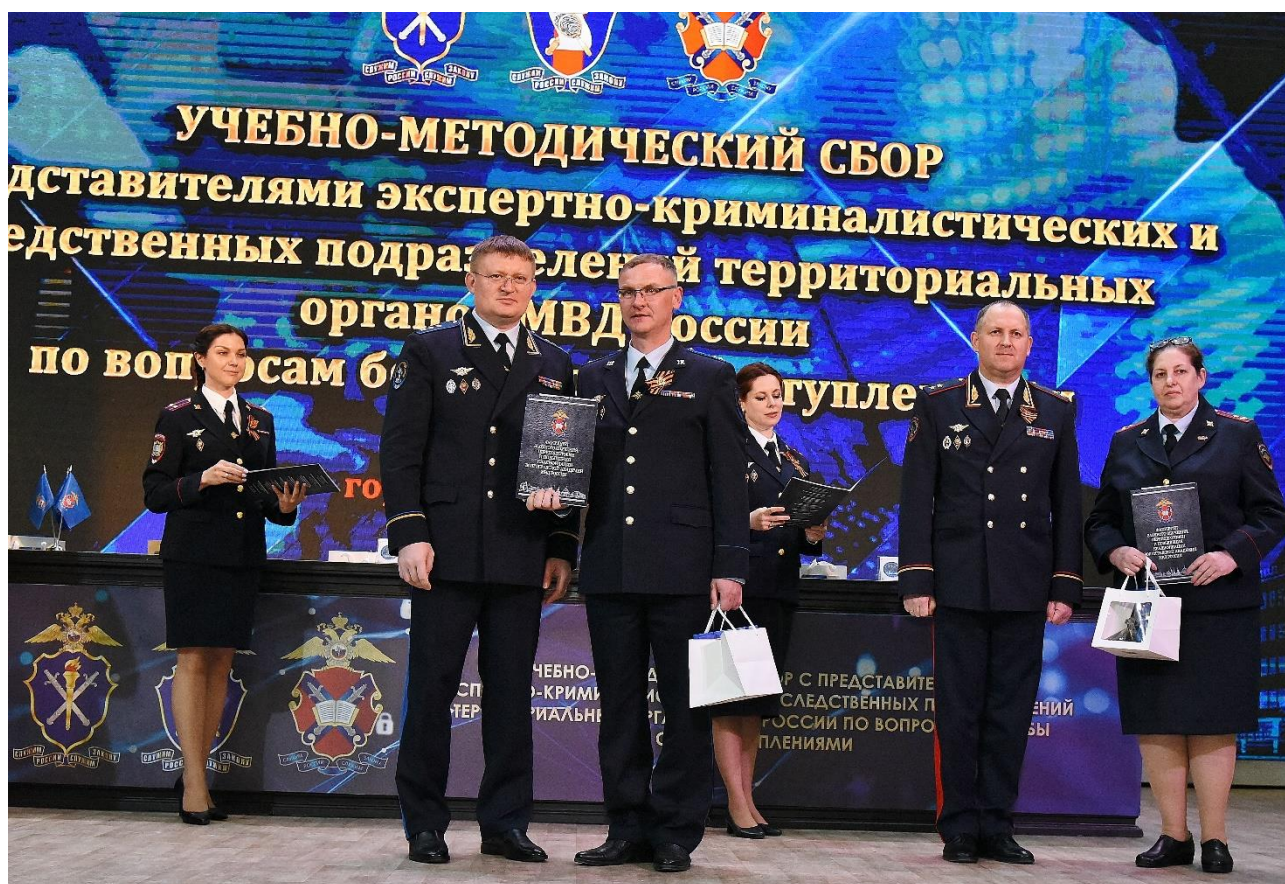
Рис. 8. Заместитель Министра внутренних дел Российской Федерации – начальник Следственного департамента МВД России Лебедев С. Н. и начальник ЭКЦ МВД России Казьмин В. В. вручают участникам учебно-методического сбора сертификаты о повышении квалификации

Таким образом, в современных условиях подготовка квалифицированных экспертных кадров с приобретением востребованных практико-ориентированных знаний и умений в ведомственных образовательных организациях является комплексной задачей, которую необходимо решать совместно ЭКЦ МВД России и ВСИ МВД России.