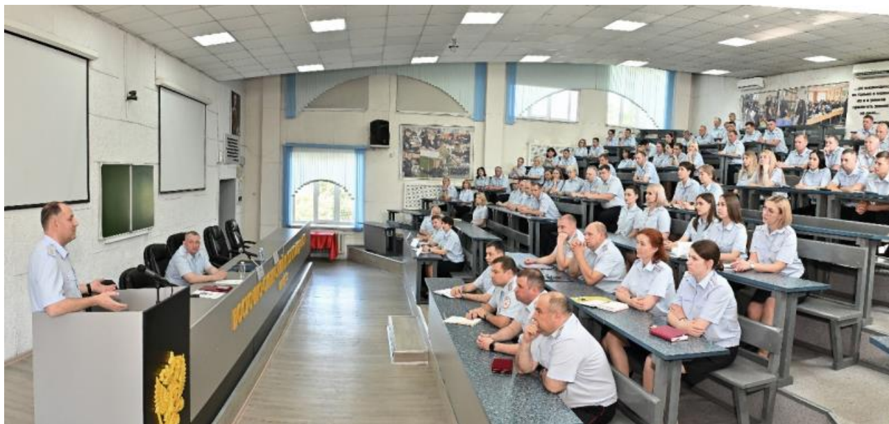
Рис. 1. Совещание с руководством и профессорско-преподавательским составом ВСИ МВД России

За образцовое исполнение служебных обязанностей и высокое профессиональное мастерство сотрудники Института неоднократно поощрялись наградами по линии экспертной службы (рис. 2) 9 .