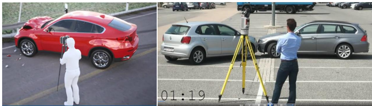
Рис. 3. Примеры применения 3D-сканера для фиксации следов на месте ДТП

Например, специалистами ЭКЦ ГУ МВД России по г. Москве при исследовании обстоятельств резонансного ДТП с участием актера Михаила Ефремова с помощью данного комплекса сопоставлялись взаимные повреждения автомобилей Jeep Grand Cherokee и LADA (рис. 4 – 5).