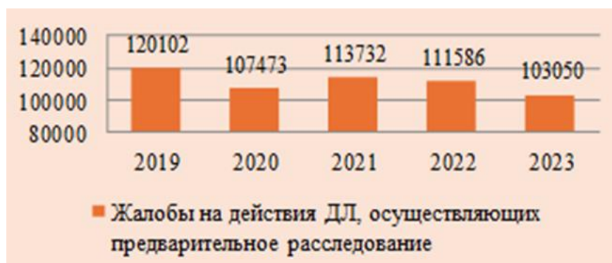
Диаграмма 2. Количество жалоб на действия должностных лиц, осуществляющих предварительное расследование

С одной стороны, при большом количестве жалоб (даже без учета обоснованности их содержания) использование оценочных категорий может негативно сказаться на уровне защищенности прав граждан. С другой стороны, именно применение оценочных категорий законодателем, как справедливо указывают некоторые авторы, является важным средством нивелирования случаев злоупотребления правом, поскольку использование в недостаточно урегулированных или неурегулированных законодательством вопросах оценочных категорий позволяет устанавливать допустимый объем и характер действий для участника уголовного судопроизводства в качестве императива, но оставляет на его усмотрение