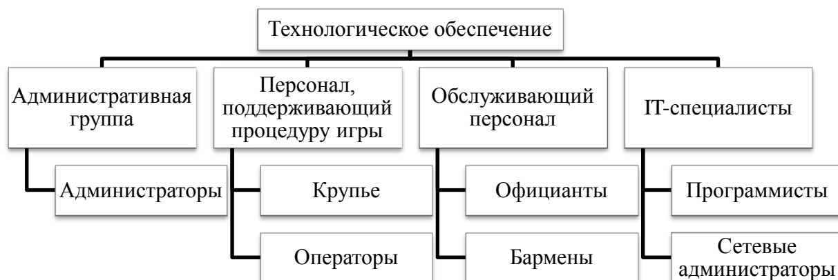
Рис. 2. Лица, осуществляющие технологическую поддержку деятельности нелегального игорного заведения

Лица, входящие в группу технологического обеспечения, создают условия непосредственно для осуществления процесса игры (рис. 2).